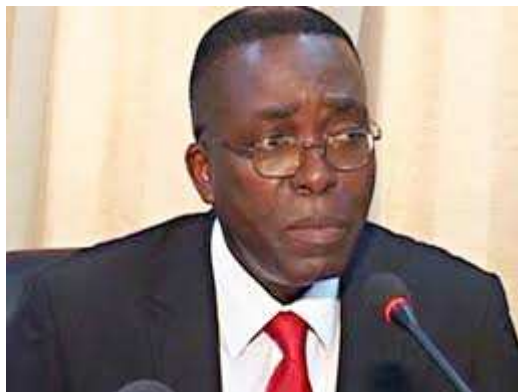
Le Premier ministre congolais Augustin Matata Ponyo

Après la nomination ce 18 avril 2012 de Monsieur AUGUSTIN MATATA PONYO en qualité de Premier Ministre de la République Démocratique du Congo, c'est finalement ce samedi 28 avril 2012 que le Président de la