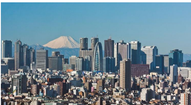
La ville de Tokyo au Japon

Développement et sous-développement peuvent se comprendre en comparant les pays du Nord dits développés, aux Pays du Sud dits sous-développés. Au premier regard, ce qui frappe le plus, c'est la différence de niveau économique. Mais cela suffit-il pour assimiler sous-développement et pauvreté ou développement et richesse ? Pour y voir plus clair, posons cette question : quelle est la cause et quel est l'effet ? Est-ce la pauvreté qui cause le sous-développement ou le sous-développement qui cause la pauvreté ?