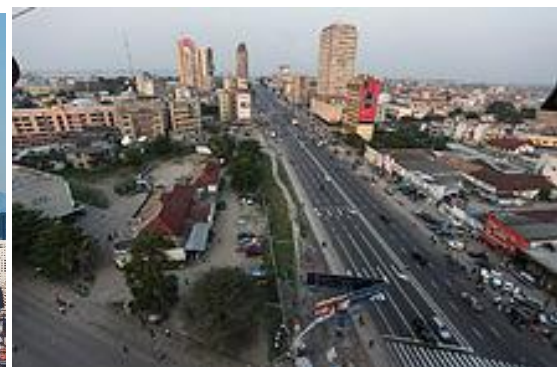
La ville de Kinshasa, Boulevard du 30 juin.